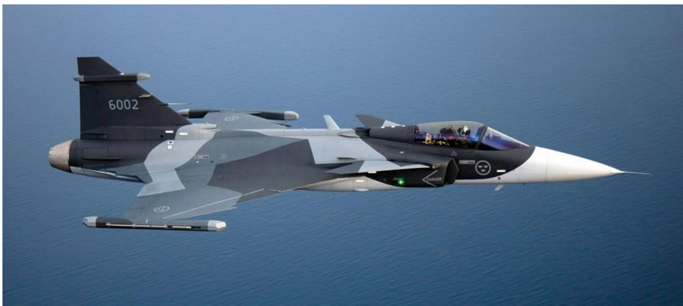
Головной истребитель JAS-39E Gripen NG для ВВС Швеции.

Тот факт, что Швеция активно наращивает свои военные расходы 4 и к 2025 году, по данным издания Defense News, объём средств, выделяемых на военные нужды, достигнет 89 млрд крон (11 млрд долларов), уже широко известен. Развитию своего ВПК шведы уделяют особое внимание. К примеру, уже давно шведский военпром самостоятельно производит многоцелевые истребители четвёртого поколения Saab JAS 39 Gripen, разработанные компанией Saab Avionics.