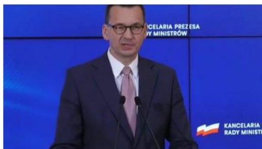
Polska popiera sankcje nakładane na konkretne osoby, by wysłać sygnał "reżimowi Łukaszenki"

принесёт белорусов в жертву Путину, если будет только критиковать и грозить санкциями.