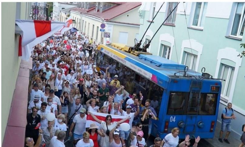
Radosny protest z flagami biało-czerwono-białymi w centrum Grodna tytuł: nowiki/grodna.ile

Важное место в польских планах занимает Гродно, где, согласно всеобщей переписи 2009 года, 19,74 % населения составляют поляки. В предвыборные месяцы в медиасфере Речи Посполитой встречались обороты вроде «вечно мятежный Гродно». С 19 августа об областном центре стали писать как о «вольном городе», подающем пример всей республике, и о происходящем переломе в пользу оппозиции. Налицо формирование образа первой, якобы свободной от власти Лукашенко территории. Поэтому новости о переброске в область дополнительных подразделений армии РБ, а особенно об учениях Западного оперативного