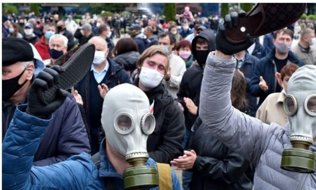
Kapcie stały się symbolem protestów na Białorusi. Aresztowany bloger Siarhej Cichanouski prowadzi kampanię „Stop karaluch”.