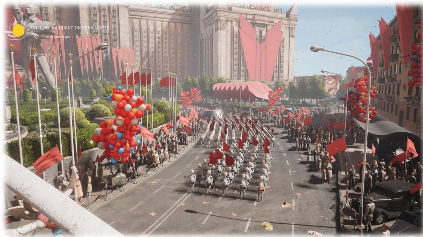
Скриншот из Atomic Heart.

Также в практически ненаблюдаемой плоскости находится ситуация с распространением видеоигр. Ярким событием 2023 года стал релиз игры Atomic Heart, которую попытались бойкотировать.